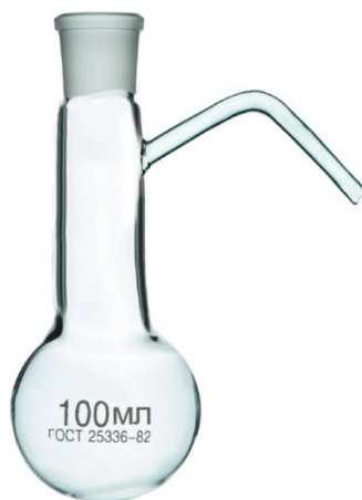
Рисунок 1 – Колба Вюрца

На одном листе может быть размещено несколько рисунков. При необходимости использования больших рисунков, которые невозможно разместить на листе размера А4, такие рисунки следует помещать в ПРИЛОЖЕНИЕ.